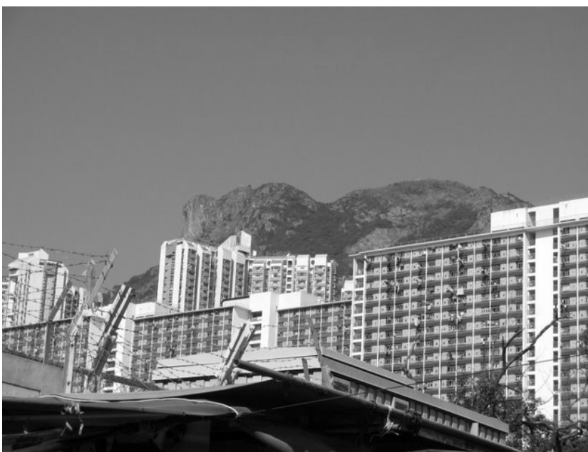
圖(網上圖片)：獅子山下的公共屋邨。公屋是基層港人的安樂窩，其商場亦為小商戶提供謀生機會。

第一，我認為大部分香港人的核心價值根本沒有改變，只是政治經濟的形勢變得越來越不利港人發展和拚搏。香港經濟在五六十幾年起飛，當時的港人雖然貧困，但是向上流動的機會卻比現在多。那時歐美的經濟開始成熟，工資變得越來越高，不得不把生產工序搬來擁有眾多平價勞動力的東亞地區，例如香港。那時，香港人可以在工廠裡打工，或者在家裡「穿膠花」做手工業，當時在工廠打工的工資並不比白領低，努力的話更可以升做「Line 長」、賺錢買樓，或者開一間茶餐廳，做一點小生意，而住在鄉郊地區的市民，務農捕魚亦可以維生。可以說，五十年至七十年代的香港人生活條件雖然差，但發展機會卻較平等，對前景亦比較有希望。但在八十年代以後，情況則大為改變。首先，一部份華資企業，由於經營有道，漸漸開始壟斷市場，變成大財團。而在高地價政策(政府控制土地供應)的影響之下，土地變得非常昂貴，使香港的商舖和房屋價格急升，漸漸脫離了普通市民的負擔能力。高昂的租金亦大大提高了小市民創業的成本，這反過來又強化了大財團的壟斷，更不用提「領匯」私有化的影響了。另外，由於港英政府缺乏長遠政策留住工業，使大量港資工廠在內地改革開放後遷往工資和土地都比香港平宜的珠三角地區，低下階層的就業機會因而大減。這些因素都減少了港人(特別是教育程度低的那一群)向上流動的機會，亦影響到他們的「拚搏精神」，因為即使拚搏，成功機會亦已減少。