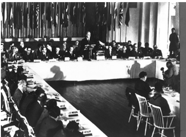
圖：1944 年布列頓森林會議